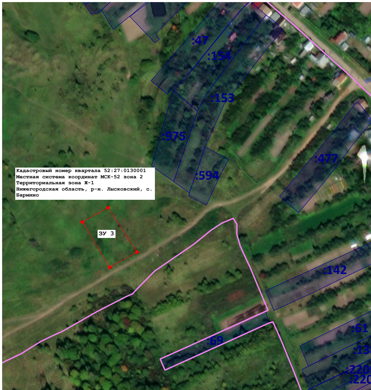
Масштаб 1:2 500